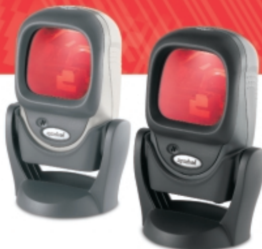
Compatibile con 2005 Sunrise Date

Gli scanner a presentazione LS 9208 presentano numerose caratteristiche che li rendono ideali per svariate applicazioni che richiedono elevate prestazioni, massima durata ed ergonomia di alto livello per ambienti POS più produttivi. Acquistando gli scanner LS 9208 si sceglie la sicurezza dei prodotti garantiti da una società che offre soluzioni ampiamente testate e scanner utilizzati in tutto il mondo.